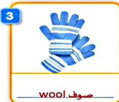
3 wool صوف gloves قفازات