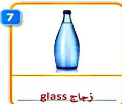
7 glass زجاج bottle قنينة