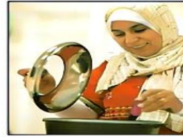
housewife ربة بيت