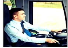
bus driver سائق حافلة