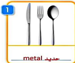
1 metal حديد knife, fork and spoon سكين وشوكة وملعقة

تمرين صفحة ٢٢ يتحدث هذا الدرس عن مواد الصنع.