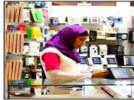
shop assistant بائع/بائعة