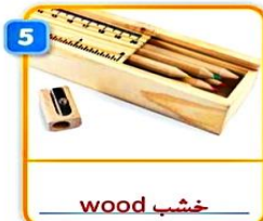
5 wood خشب pencil case علبة أقلام رصاص