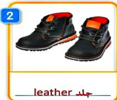
2 leather جلد shoes أحذية