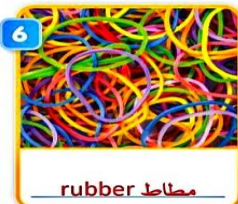
6 rubber مطاط bands أربطة