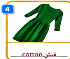
4 cotton قطن dress فستان