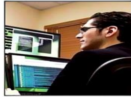
IT programmer مبرمج تكنولوجيا معلومات