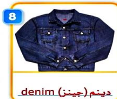
8 denim (جينز) jacket سترة